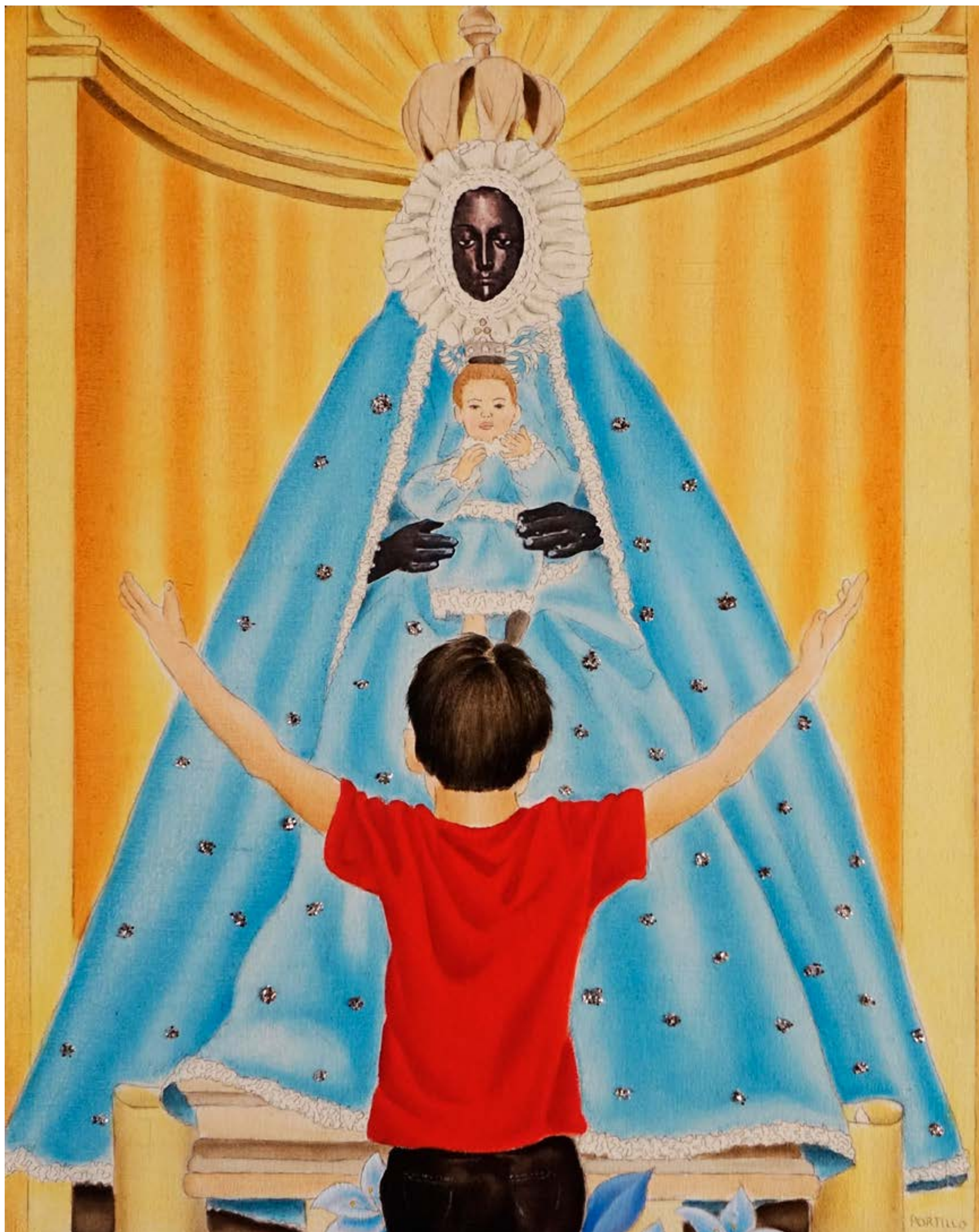
La Virgen de Regla y yo, 2020 Óleo, lápiz y collage sobre tela 50 x 40 cm Obra única